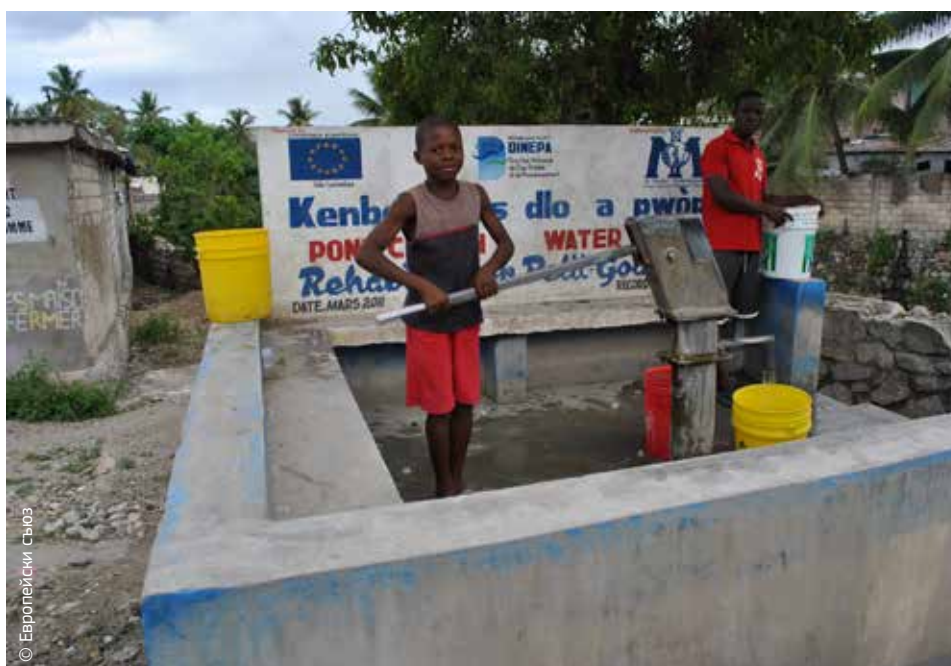
В Хаити ЕС подпомага ремонт на основни услуги — течаща вода и канализация в малки градове като Пти-Гоав.

ЕС е водещ донор в Хаити, като се ангажира да предостави общо 1,235 млрд. евро, като обедини финансирането от Европейската комисия, страните от ЕС и Европейската инвестиционна банка. Той ще продължи да предоставя всеобхватна помощ в подкрепа на възстановяването и развитието на страната през следващите години.