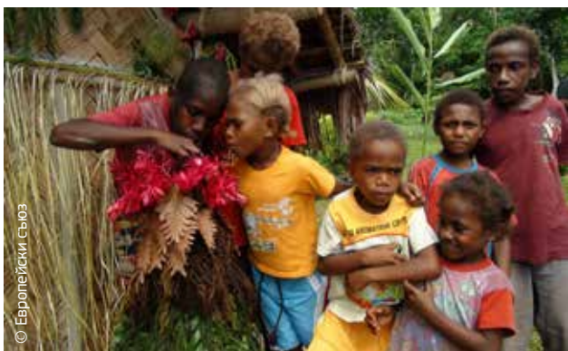
Във Вануату деца помагат за построяване на модел на най-голямата заплаха за живота си — вулканът на планината Гарет.

Европейската комисия се съсредоточава върху устойчивостта — по този начин ще бъдат спасени повече човешки животи, това ще се окаже икономически по-ефективно и ще допринесе за намаляване на бедността, като по този начин се стимулира въздействието на помощта и се насърчава устойчивото развитие.