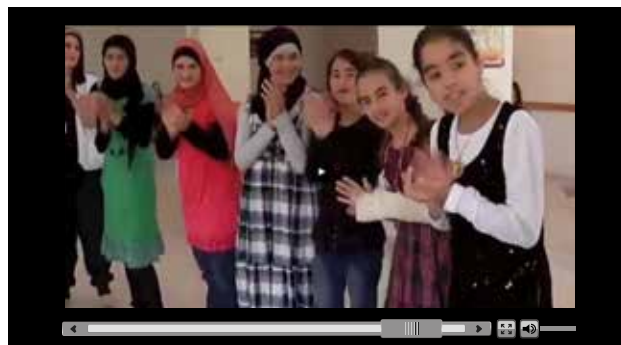
Образованието помага на децата в конфликти да останат деца.

Като има предвид това, Европейската комисия прикани партньорски хуманитарни организации и агенции да предложат подходящи проекти за финансиране. В резултат на това беше взето решение паричните средства от Нобеловата награда за мир да бъдат дадени на четири проекта в рамките на инициативата на ЕС „Деца на мира“. Заедно тези проекти достигат до повече от 23 000 деца в Ирак, Колумбия, Еквадор, Етиопия, Демократична република Конго и Пакистан, предоставят достъп до основно образование и подходящи за децата помещения, осигуряват защита, образование и възможност за по-добро бъдеще.