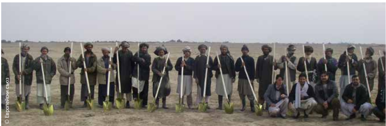
Афганистанци получават инструменти като част от помощта от ГД „Хуманитарна помощ и гражданска защита“ във връзка със суша, предизвикала глад и разселване.

Договорът от Лисабон, влязъл в сила на 1 декември 2009 г., въведе правна основа за хуманитарната помощ на ЕС и за политиките в областта на