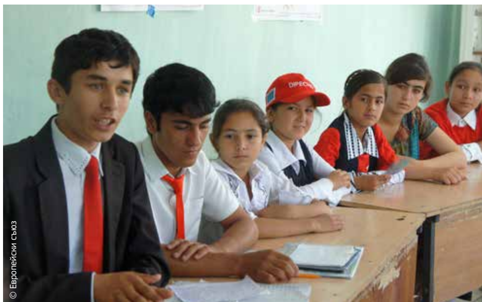
Доброволци в Таджикистан се обучават като част от екипи на общността за спешно реагиране по програмата „Dipecho“.

Другите сценарии включваха горски пожари, причинени от искри от спирачките на влак, или село, наводнено от неизправна резервоарна система. Упражненията от този вид се организират всяка година с финансовата помощ на ЕС.