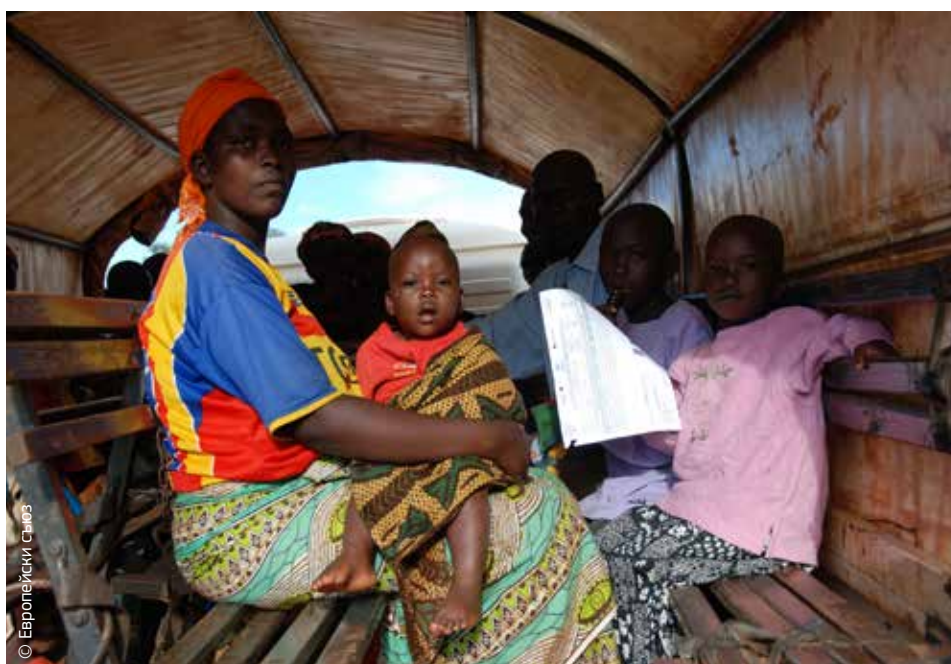
Това разселено семейство от Бурунди се завръща в дома си благодарение на помощта на ЕС за презаселване.

За да могат дългосрочните резултати от бедствията да се управляват, а предотвратяването и подготвеността при бедствия да бъдат засилени, хуманитарната помощ и реакцията при кризи трябва да вървят ръка за ръка с дейности в други области, включително сътрудничеството за развитие и опазването на околната среда. Това изискване придава съществено значение на координацията на равнище ЕС.