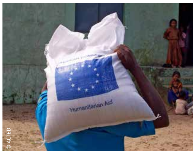
ЕС финансира хуманитарната помощ в Индия от 1996 г. насам.

Европейският съюз е сред водещите донори на хуманитарна помощ в света. Този принос има огромно въздействие по места. Само през 2012 г. ЕС е предоставил помощ на 122 милиона души в над 90 държави извън ЕС.